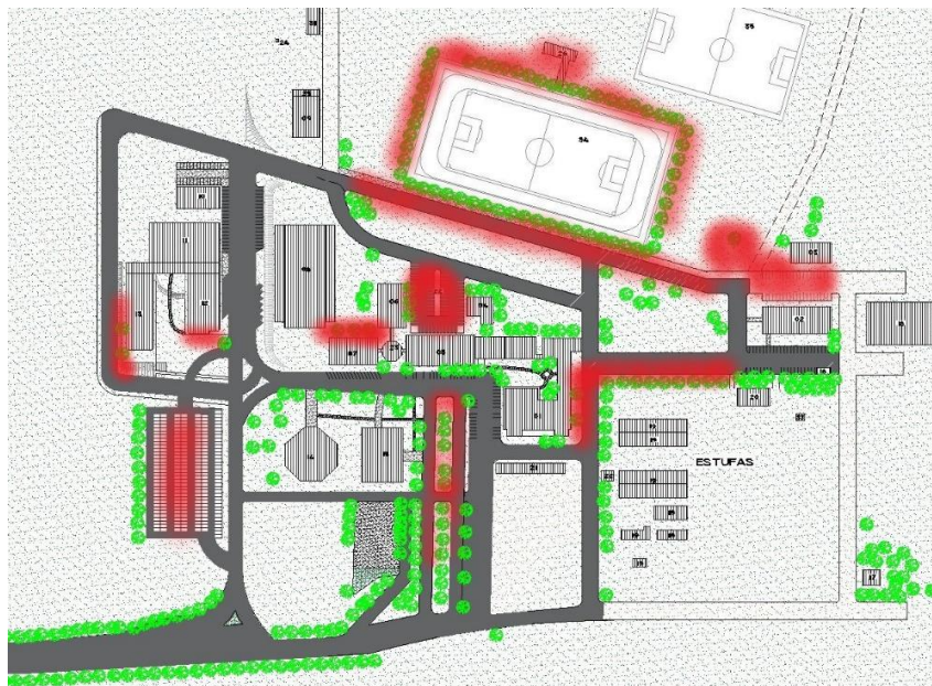
Figura 01 – Implantação do campus universitário Unicruz delimitando as áreas em vermelho como iluminação inadequadas ou insuficientes.